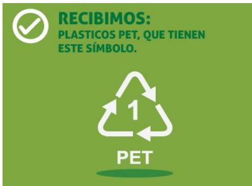
Recibimos: Plásticos PET, que tienen este símbolo.

PET 1 ó PETE (polietileno tereftalato) Es el de las botellas de refresco, de agua, potes de mayonesa, enjuague bucal, aceite, vinagre y otros. Por lo general es de un solo uso y es transparente.