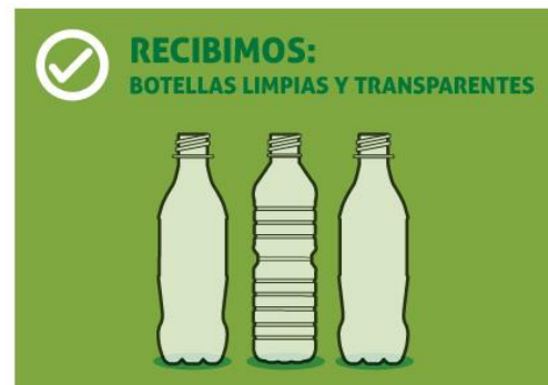
Las botellas deben estar limpias (no opacas ni quemadas por el sol, pueden ser de color totalmente transparente, con tonos celestes, verdes o morados).