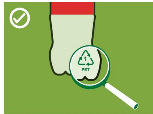
Símbolo reconocible en la base de las botellas.