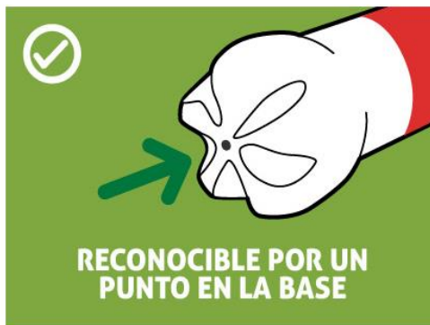
Botellas de PET son reconocibles por tener un punto en su base en lugar de soldadura.